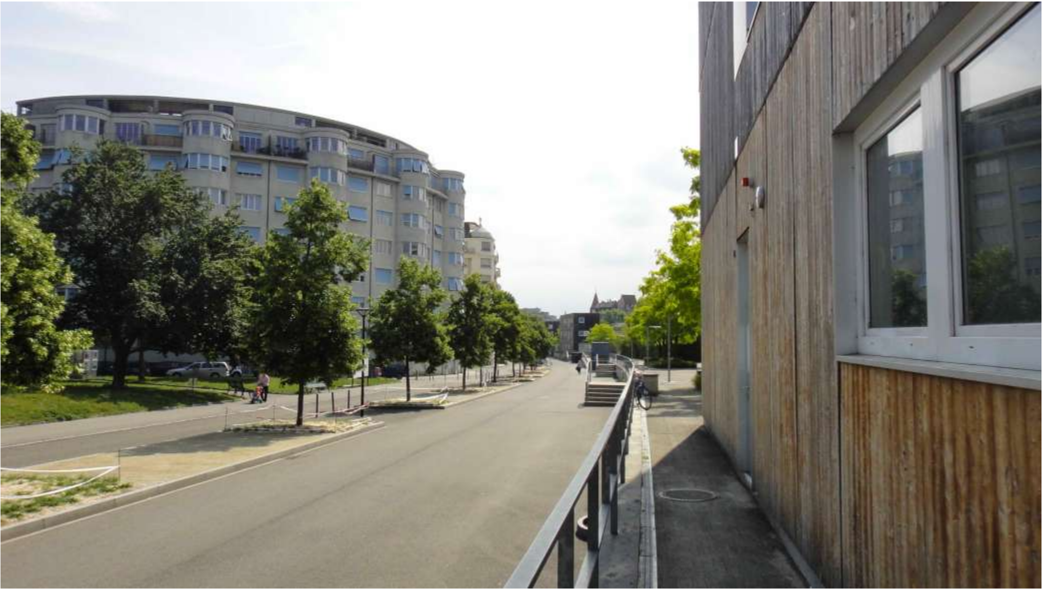
Il quartiere di Charmilles visto verso la Stazione FFS.