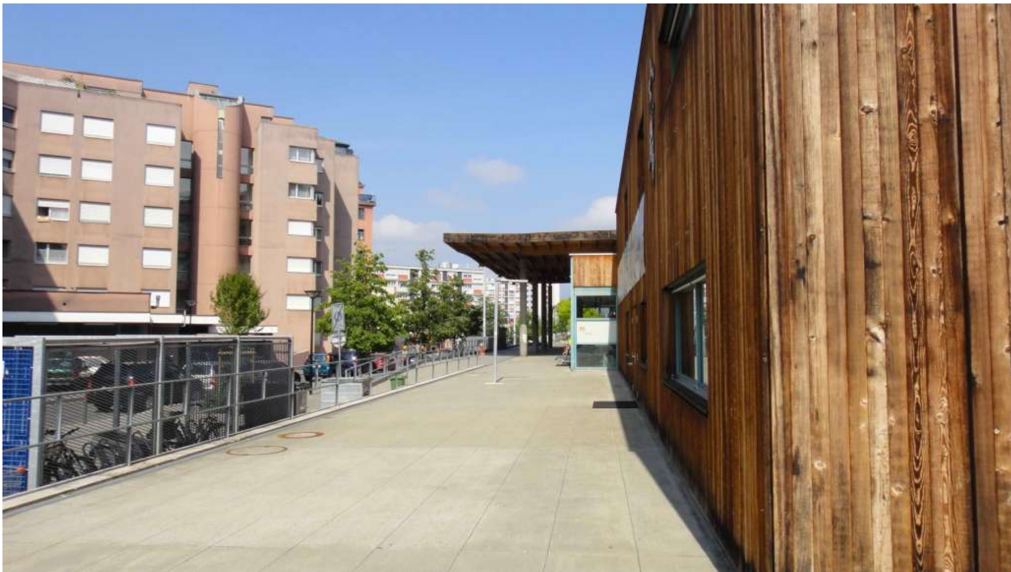
Il quartiere St.Jean visto verso Ovest.