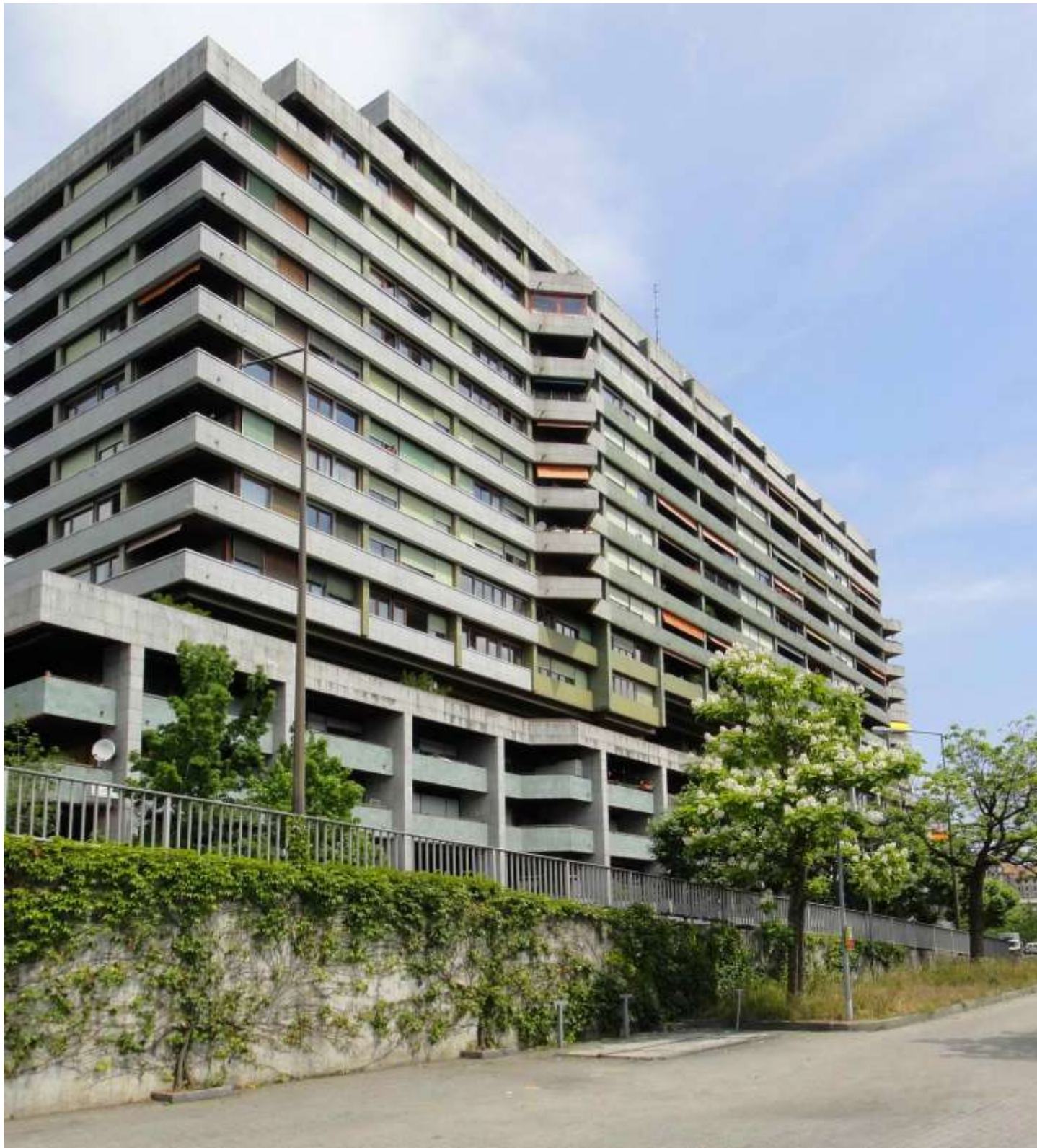
L'estremità ovest dell'immobile tra rue St.Jean e il quai du Seujet.