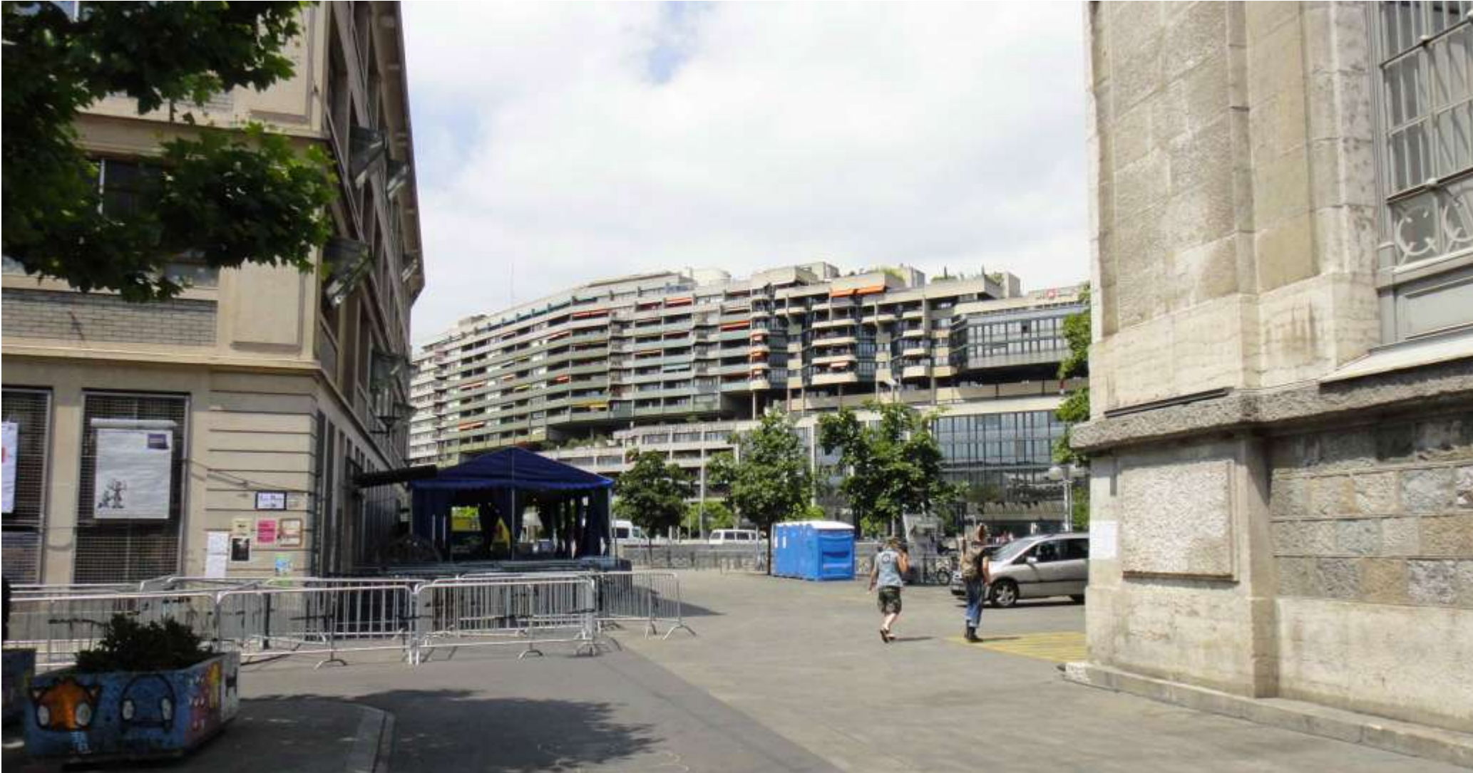
Lo stesso complesso visto da l'Isola (l'Isola).