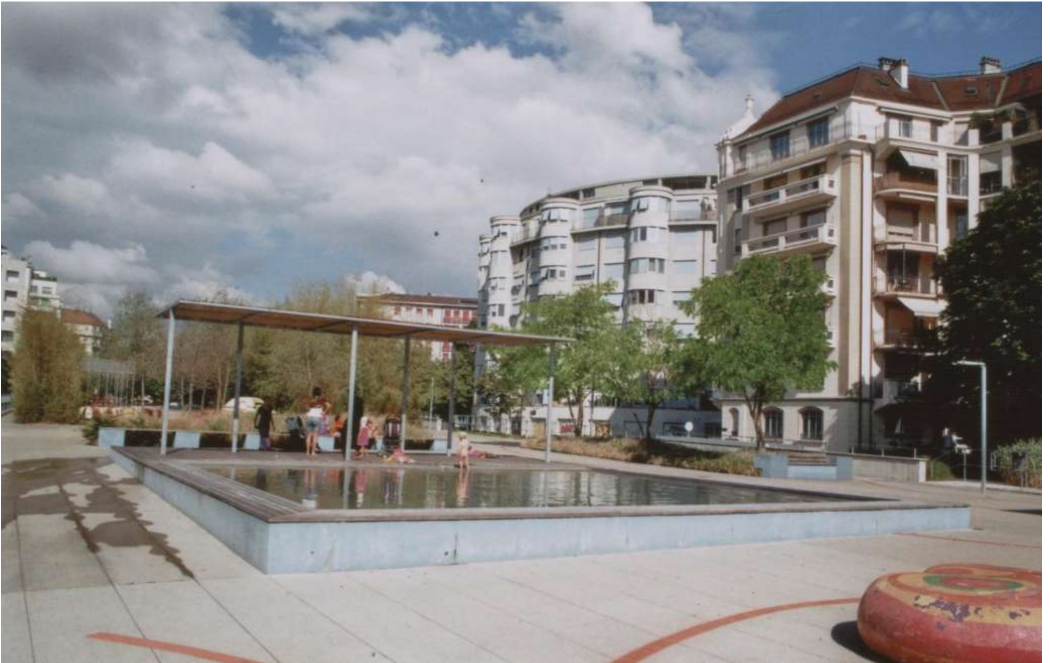
Il percorso centrale attrezzato a parco giochi.