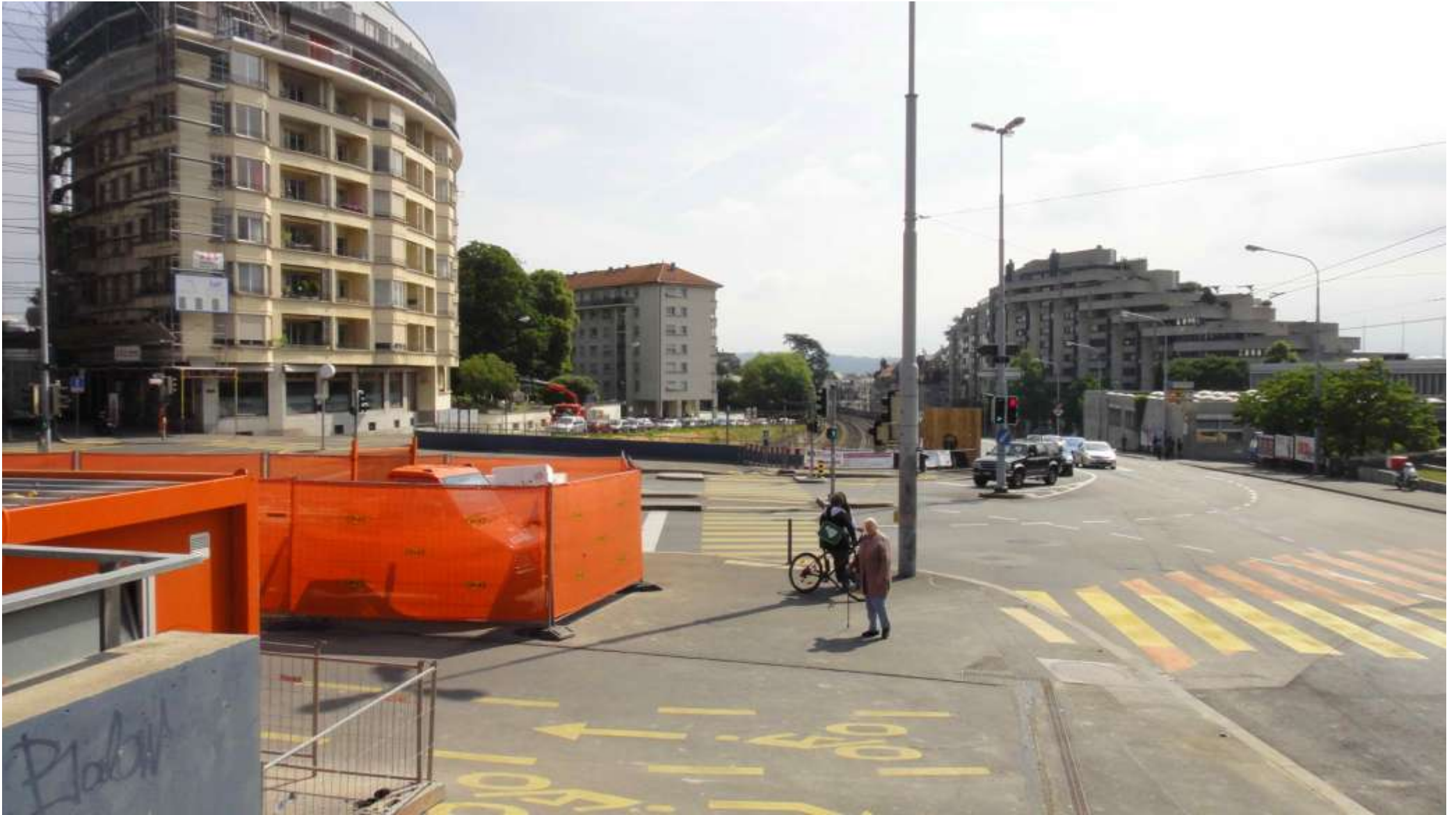
Il Pont des Délices delimita a Est il Parco della Trincea, a Sud la imponente ma elegante edificazione in linea su rue St. Jean.