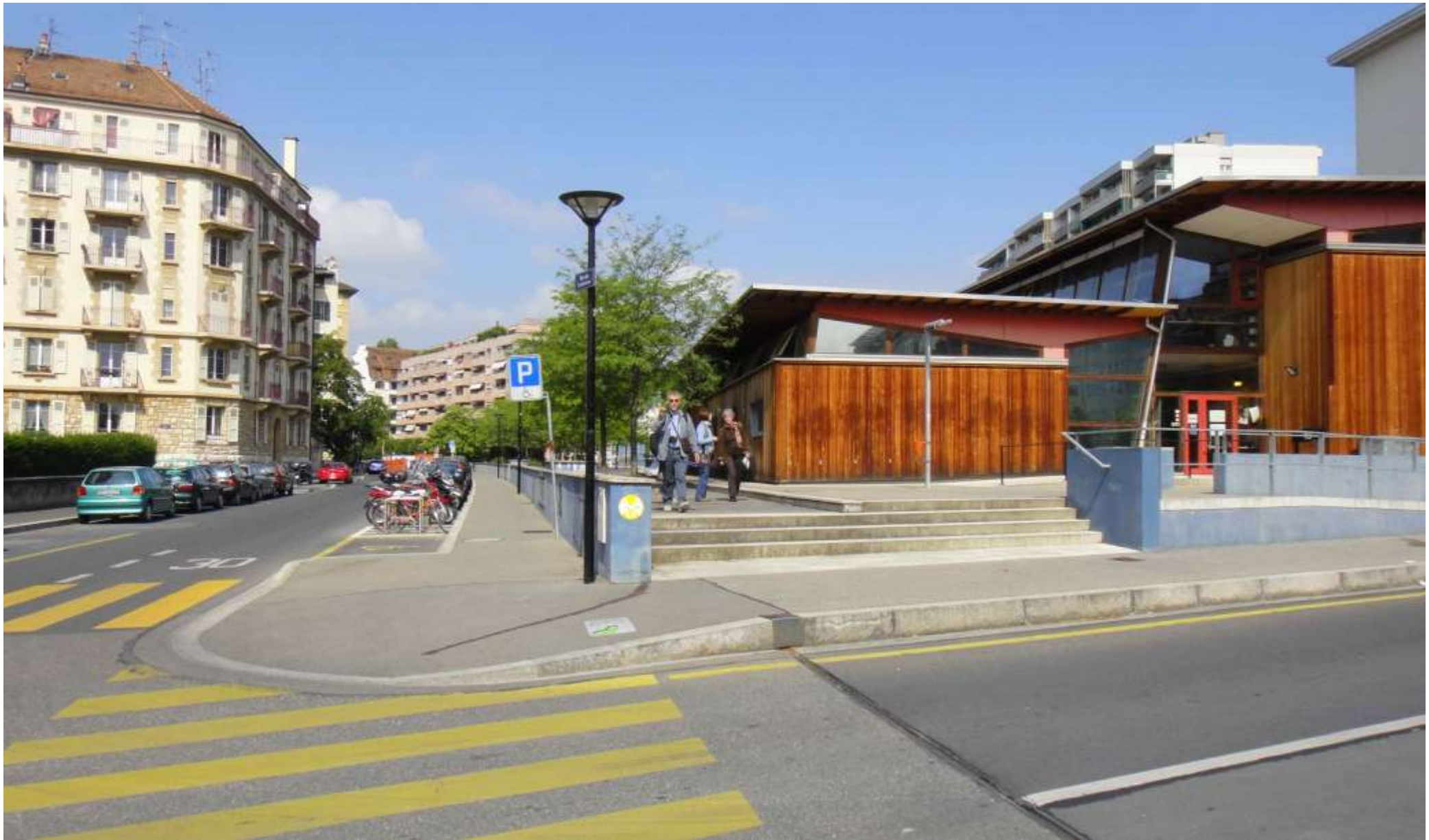
Il quartiere St.Jean visto verso Ovest.