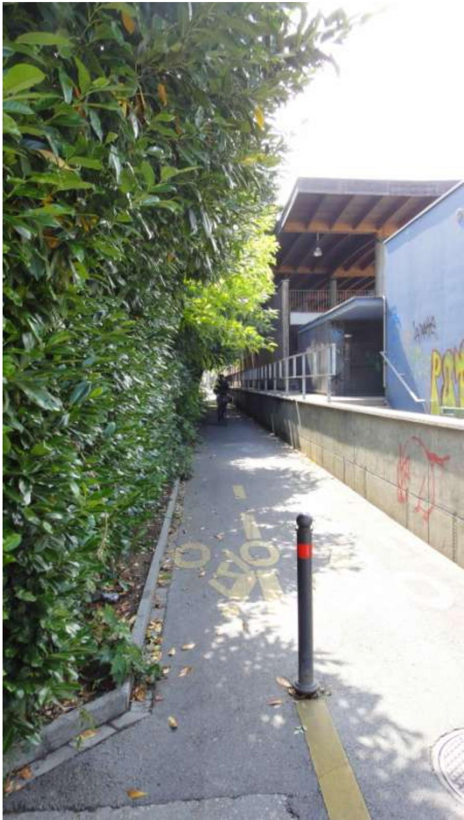
La pista ciclabile all'altezza della Maison de Quartier.