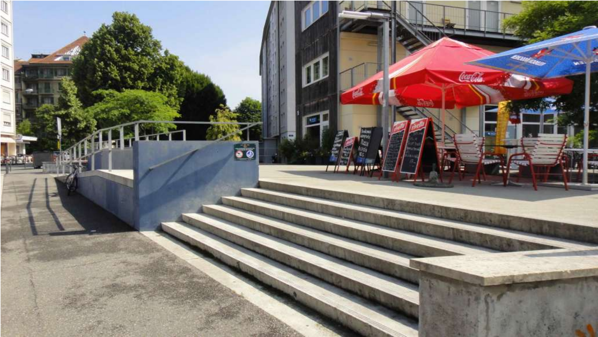
Il quartiere St.Jean.