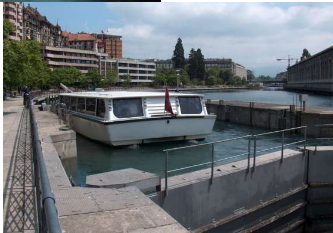
Quai du Seujet all' altezza della chiusa.