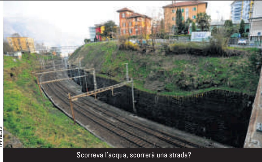
Scorreva l’acqua, scorrerà una strada?

Giusto il tempo di tornare in redazione dalla conferenza stampa che sulla scrivania è già bell’e stampato il comunicato stampa congiunto del Partito popolare democratico, Partito liberale radicale e Lega dei Ticinesi. Fra le righe l’utilizzo di parole pesanti, così come dimostra di essere ora il clima in paese. «Con il pretesto di impedire l’edificazione di una fantomatica strada – scrivono le tre formazioni – Massagno Ambiente ritarda la copertura della trincea e blocca l’insediamento della Supsi». Un’accusa grave