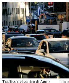
Traffico nel centro di Agno

anticipa che la città potrà partecipare all'investimento con un milione di franchi annui. Insomma il sostegno anche 'tangibile' sembra esserci: se tutto andrà come sperato, i lavori di costruzione potrebbero iniziare nel 2022.